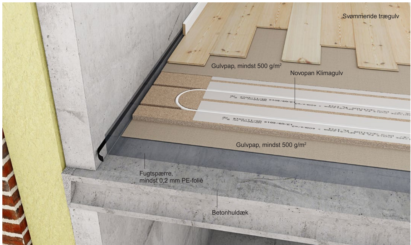
Figur 1 Novopan Klimagulv lagt svømmende på et etagedæk af beton og afsluttet med et svømmende trægulv – mindst 12 mm.

Anvendes der vendeplader som alternativ til fræsning af vendespor skal de lægges i henhold til monteringsanvisningerne Novopan vendeplader til 22 mm Klimagulv og Novopan vendeplader til 25 mm Klimagulv .